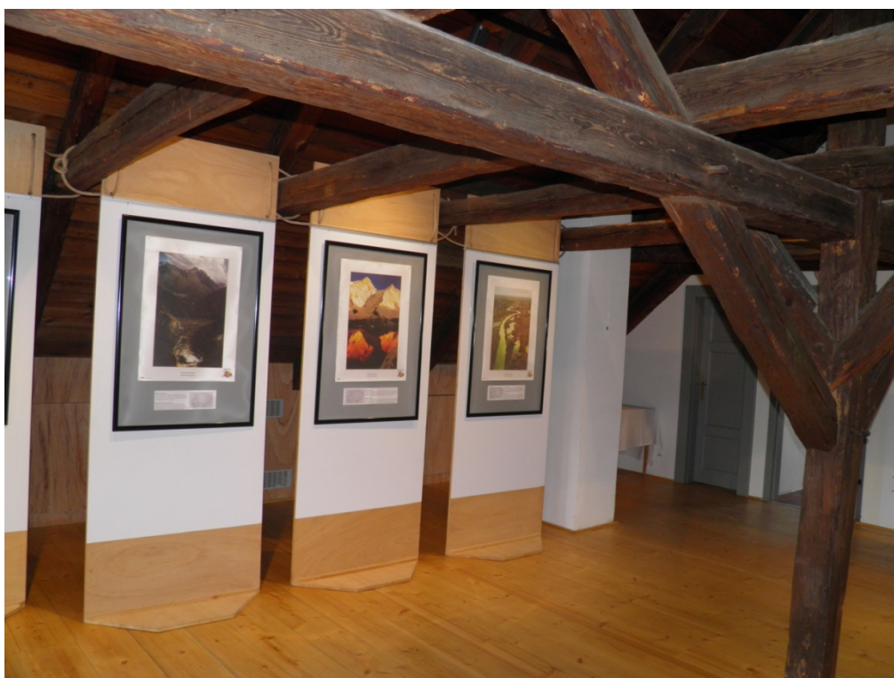
Výstava Kazachstán v galerii města Mimoně