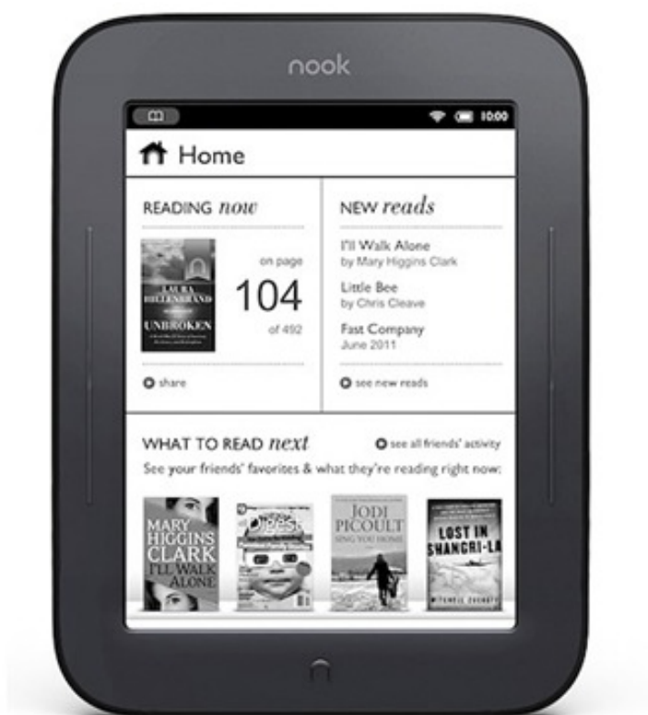
Obr. č. 5 Čtečka Nook Simple Touch

Čtečka svým uživatelům umožňuje práci s elektronickými dokumenty různých formátů. V čtečkách mohou číst vlastní (koupené) e-knihy, které je ale vždy před vrácením čtečky nutné vymazat. Také si mohou na omezenou dobu stáhnout odborné e-knihy, které zakoupila PřF, jako tzv. offline výpůjčku. Dostupné jsou přes systémy Ebrary nebo EBSCO eBook collection. Návody na použití čtečky a práci se systémy jsou vždy přiloženy ke čtečce, která se půjčuje.