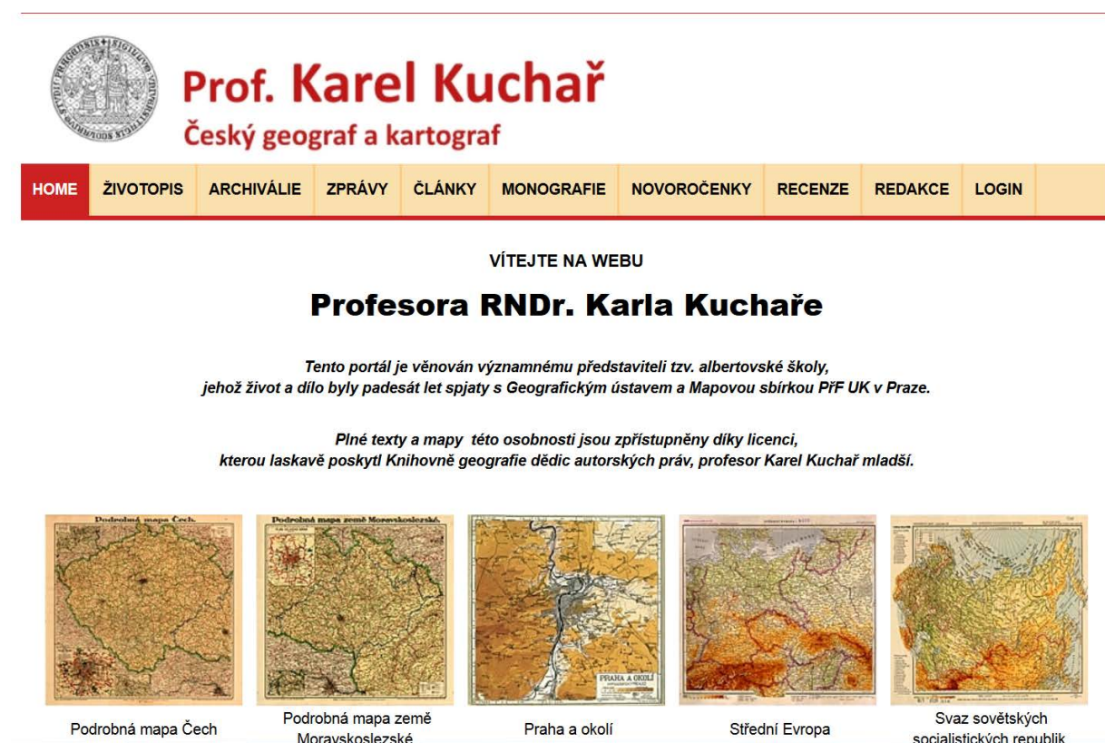
Obr. č. 16 Úvodní stránka portálu profesora K. Kuchaře

novoročenek, 14 monografií a 12 archivních snímků ze života Karla Kuchaře). Sekce životopis obsahovala k výše uvedenému datu také 4 hypertextové odkazy a 2 videa. Hlavní cíl celého portálu je tedy nasnadě. Přiblížit široké veřejnosti život profesora Karla Kuchaře prostřednictvím zpřístupnění jeho celoživotního díla a umožnit tak pomocí internetu přístup k unikátním mapám či plným textům. Odkaz na celý portál prof. Karla Kuchaře je samozřejmě umístěn i na jeho osobní stránce v rámci webové Galerie otců zakladatelů geografie.