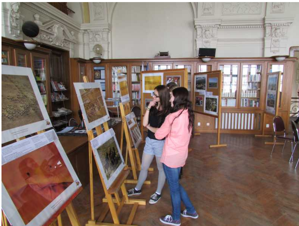
Výstava Atlas krajiny ČR v prostorách knihovny Gymnázia Teplice