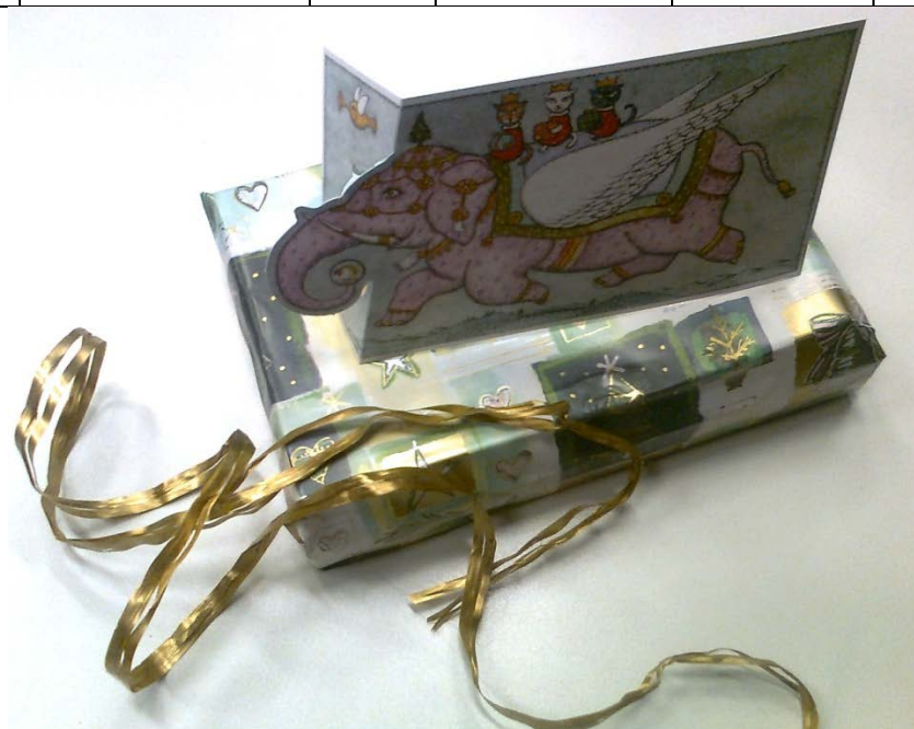
Obr. č. 1 Knížní vánoční dárek pro Knihovnu geografie od čtenářky H. Bednářové