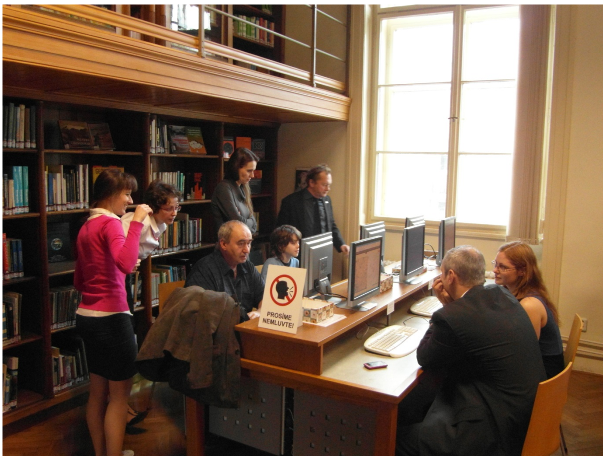
Obr. č. 7 Georeferencování starých map za asistence pracovníků knihovny a Mapové sbírky se konalo u příležitosti otevření zrekonstruované Mapové sbírky

ekonomickém oddělení. Kalkulace poštovního (pro všechny české i zahraniční zásilky) činí přibližně 40 tisíc Kč. Při odesílání zásilek s AUC Geographica spolupracuje knihovna s Geografickou sekcí a dr. Miroslavem Šobrem. Sekce se finančně podílí na platbě poštovního a poskytuje auto, kterým dr. Šobr odveze zásilky na poštu. Na poště je kvůli velkému počtu zásilek nutné předem domluvit termín dodání.