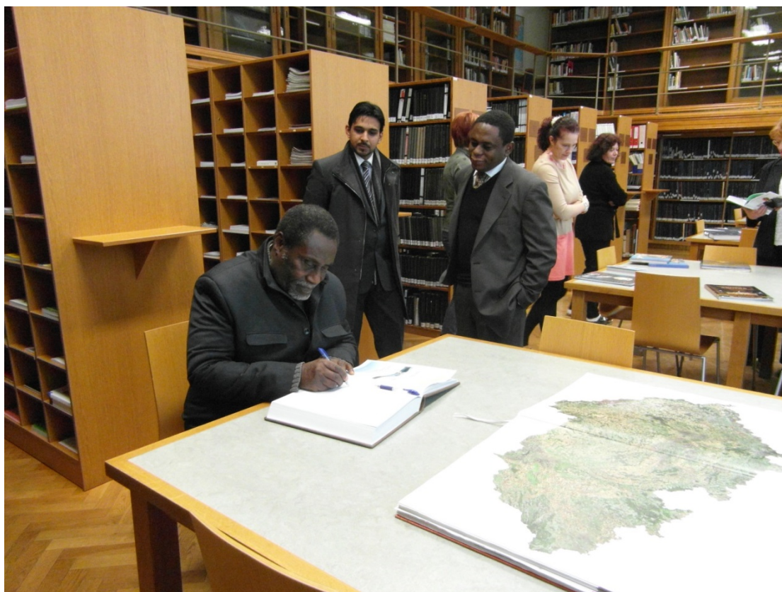
Obr. č. 12 J.E. p. Samuel Mbrayeh Quartey, velvyslanec Ghany, se podepisuje do výstavní knihy u příležitosti vernisáže výstavy Kazachstán – srdce Eurasie

ŽABIČKA, Petr. StaréMapy.cz – úspěšný příklad spolupráce knihoven s veřejností. Ikaros [online]. 2013, 17(4) [cit. 2013-12-17]. ISSN 1212-5075. Dostupné z: http://www.ikaros.cz/node/7906 .