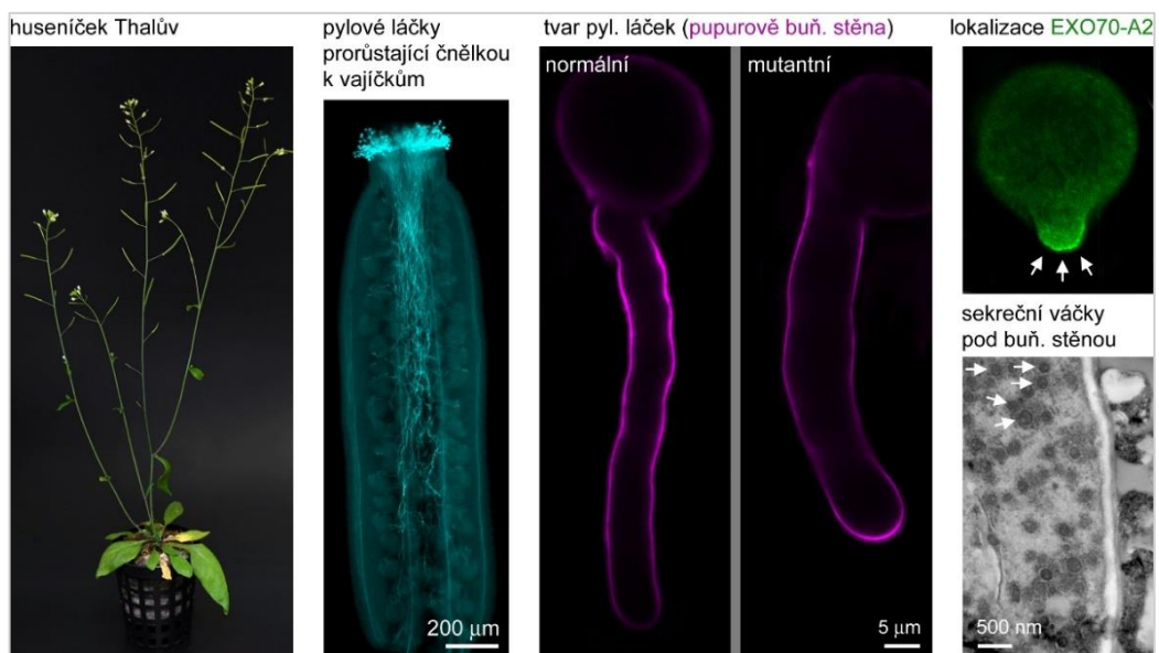
Pylové váčky v huseníčku