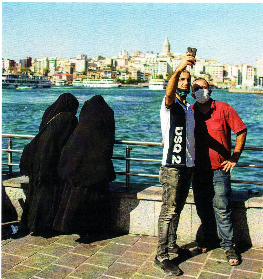
Všední den v časech pandemie. Istanbul 7. října 2020.

relativně moderátní, ale planeta jako celek šíří, vy-mknuta z kloubů – jak krásným vyjádřením situa-ce společenských elit je Boschův obraz Fůra sena : králové a preláti jedou s výhledem zcela zastíněným velkou fůrou a nevidí demony, táhnoucí vpředu namísto koní vůz. Jednotlivé státy bizarně závodí, aby snížily počty nakažených – přitom by si paradoxně podobné „pandemie“ před třiceti lety nikdo ani nepovšiml. Péče o nemocné poměrně rychle a plynně přechází v šikanování zdravých, „lčení“ relativně lehké nemoci na celospolečenské úrovni bude mnohem horším problémem než choroba sama. Je dobře připomenout, že zemřelých s koronavirem (nikoli nutně na koronavirus) je u nás asi tolik (psáno 5. října), kolik se lidí ročně zabije v autech, na která jsme si ale zvykli a máme je za „nutná“. To, že sebevražednost vinou stále šířených vln děsu už stoupla na dvojnásobek (sebevražda a smrti při autohaváriích je ročně zhruba srovnatelný počet), nás nechává