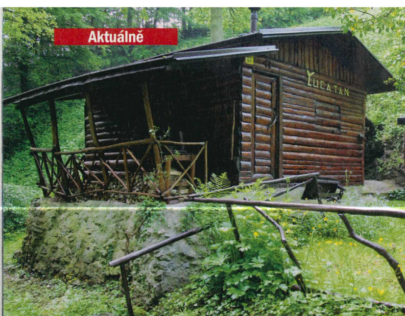
STARÉ A NOVÉ. Chata nad Beroučkou v Srbsku (vlevo) je vzpomínkou na původní trampské osady. Ke stylu srubu se vracejí i někteří majitelé rekreačních novostaveb (vpravo).