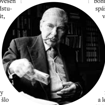
Arthur Koestler.

Zlepšení po roce 1989 bylo jistě zcela neobyčejné, ač bylo nutné se vyrovnat s tím, že zdravý rozum musel někdy ustoupit formálnímu právu, smysl věci zisku nebo výši obodování, veřejný prostor a později internet jsou zaneřáděny vlezlými reklamami a celá řada nejlepších „tržních trháků“ byly věci zjevně neúčinné typu někdejších Rubikových kostek a „zvířátek“ Tamagoči či později počítačových her. Je smutnou skutečností, že vláda peněz, jakkoli je čímsi neradostná, neosobní a znevolňující, nevede k ideologickým rozkolům, protože peníze jsou jedny a „všichni chtějí vlastně totéž“, zatímco ideje je mnoho a vedou do „svatých válek“ nutně. Sebezáslužnější myšlenka se neustálým propagandistickým a reklamním rozpatláváním stává prázdnou a škodlivou frází. Teď se naše společnost i svět jako celek začínaly měnit opět: zas bude