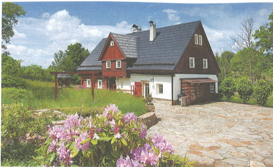
Roubenka v Křižanech. Její kamenná část byla postavena v roce 1827, dřevěná část je starší.