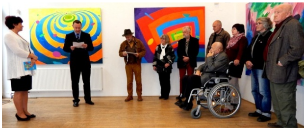
Představení přítomných autorů