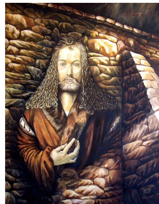
Pocita Dürerovi A tribute to A.Dürer

Art – Vernisages - Exhibitions – Auctions – News – Meetings malíře, grafika a ilustrátora Václava Smejkala