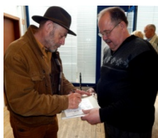
Výtvarník Aleš Lamr