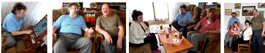
Povídání s přáteli u kávičky a čas bohužel plynul mnohem rychleji než bychom chtěli.

art skupiny „Sešlost šestnáct plus minus“. V ní se pak etablovali výtvarníci z okolí Letovic, ale nejen odtamtud. Malbě se věnuje od školního věku a vystavuje posledních 20 let. Na svém kontě má kolem 70 kolektivních a autorových výstav, po celé ČR. Např. Slavkov, Moravská Třebová, Choceň, Litomyšl, Brno, Zábřeh, Jeseník, Letovice, Ledec n.S., Přelouč, Polička atp. Je zastoupen i v soukromých sbírkách v zahraničí, nejdále v Japonsku. (05/2015)