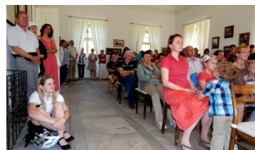
Návštěvníci v hlavním sále