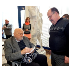
Sochař Olbram Zoubek