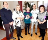
manželé Uhlířovi, pí E.Kovářová, autor