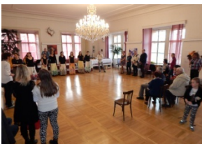
pohled do sálu