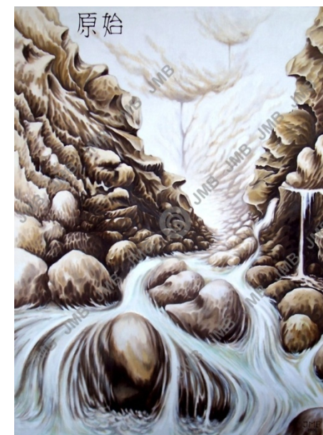
Údolí duchů (olej, 160x120cm) Valley of the spirits