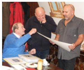
diskuze nad grafikou