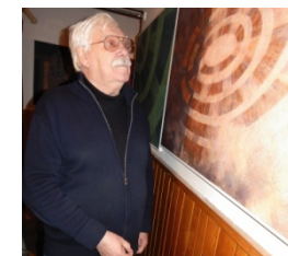
autor a jeho obrazy