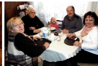
posezení u stolu