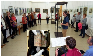
úvodní slovo ředitele