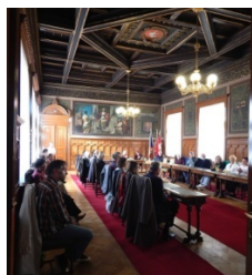
aula plná literátů