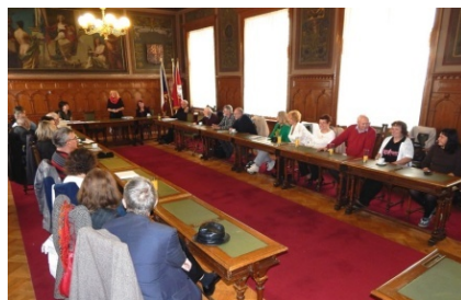
historický sál radnice