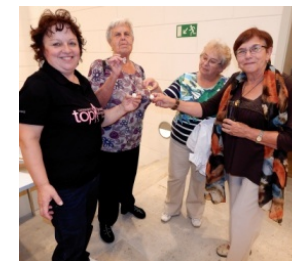
dobré vily a strážkyně VU