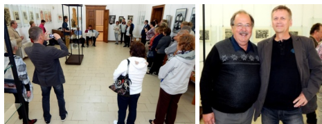
návštěvníci na vernisáži