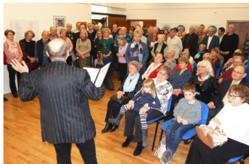
moderátor večera exceloval