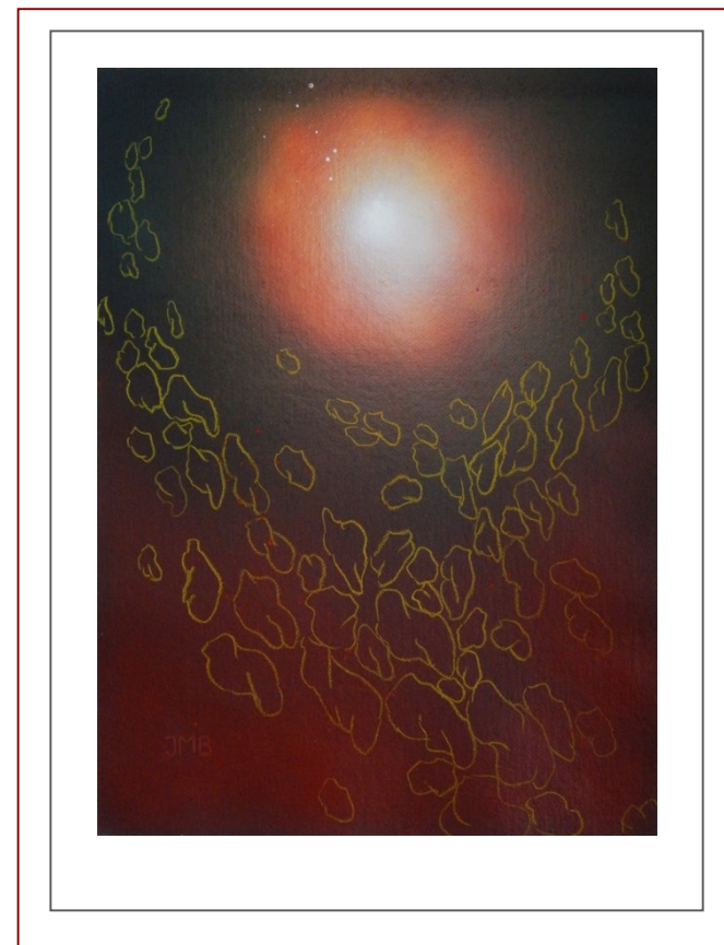
Kompozice 102 Composition 102

malíře, grafika a ilustrátora Václava Smejkal