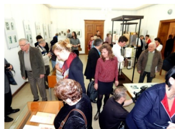
sál s expozicí