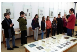
komentovaná odborná prohlídka