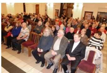
dvorana Městského muzea