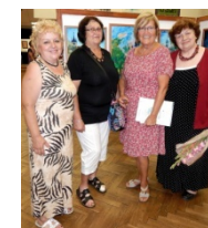
4 x Marie