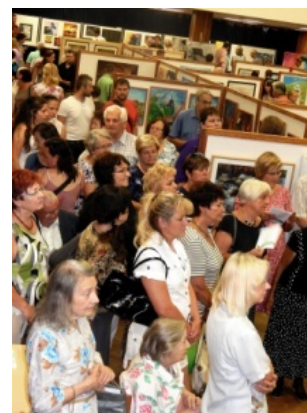
Pohled do sálu