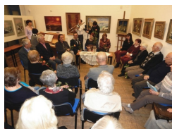
Přítomní jubilanti roku 2016