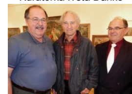
Malíř Jindřich Šmégr