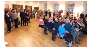
Pohled do sálu