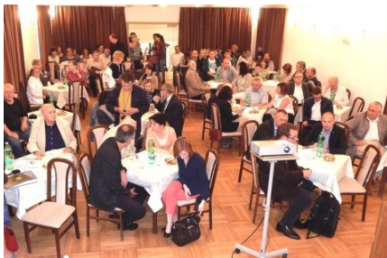
Pohled do sálu lanškrounského Zámku