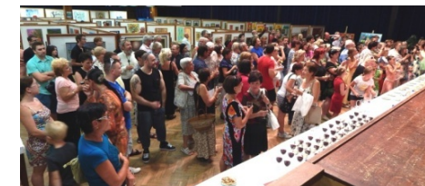
Pohled do řad návštěvníků vernisáže