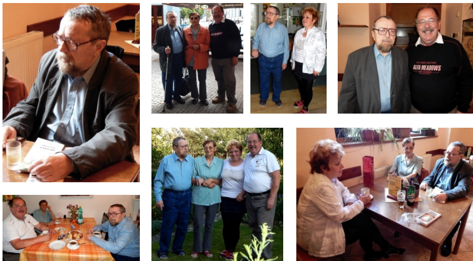
Pozorní hostitelé vytvořili pohodu, jež nám vydržela po celý slunečný den.