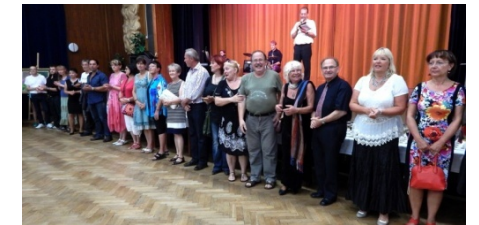
Nástup přítomných autorů

lové. Podbarvení večera zpříjemnilo duo na elektronické varhany a bicí. Následovala volná diskuze a setkání s přáteli při prohlídce vystavených děl. K vidění byly obrazy, plastiky, fotografie, šperky a drátkované artefakty. Pro JMB je to 81. prezentace jeho obrazů v pořadí. Prodejní výstavu Klubcentra lze shlédnout v Kulturním domě v Ústí nad Orlicí do 6. září 2015.