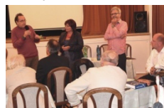
Informace a dotazy