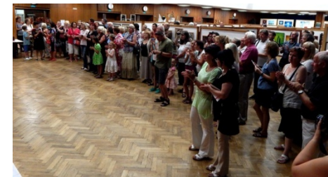
Sál s návštěvníky