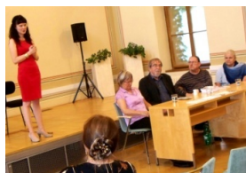
Úvodní slovo předsedkyně a hostů