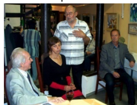
Majitel galerie představuje vystavující autory