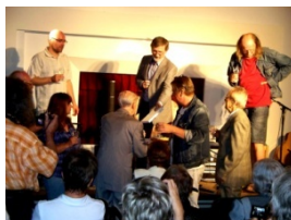
Křest knihy „Brandýs jakoby“