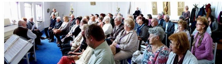
Pohled do obřadní síně