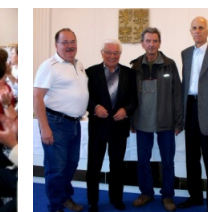
Oficiální delegace ze SVČS Pardubice