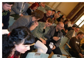
Přítomní členové SVČS