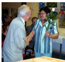
Kytice pro aktéry