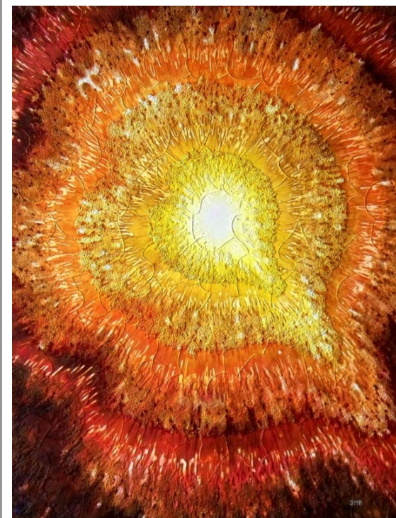
Kompozice IV. (Valentinské téma)

VÝTVARNÉ UMĚNÍ–VÝSTAVY–AUKCE–ZPRÁVY–NOVINKY–SETKÁNÍ malíře, grafika a ilustrátora Václava Smejkal